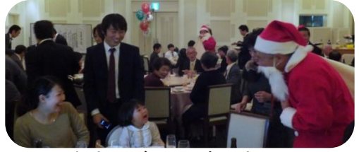
なまはげ?じゃありません サンタクロースです!!

シェブロン賞は、ライオンズの長期にわたる奉仕を表彰するもので、最短10年間から5年刻みで最長75年間の奉仕を讃えます。シェブロンには2種類の賞があり、チャーター・メンバーのみに与えられるチャーター・モナーク・シェブロン、そしてもう一つはモナーク・シェブロンです。