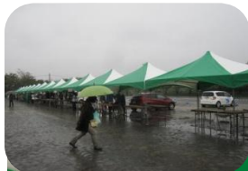
←暴風雨の中開催 昼で中止