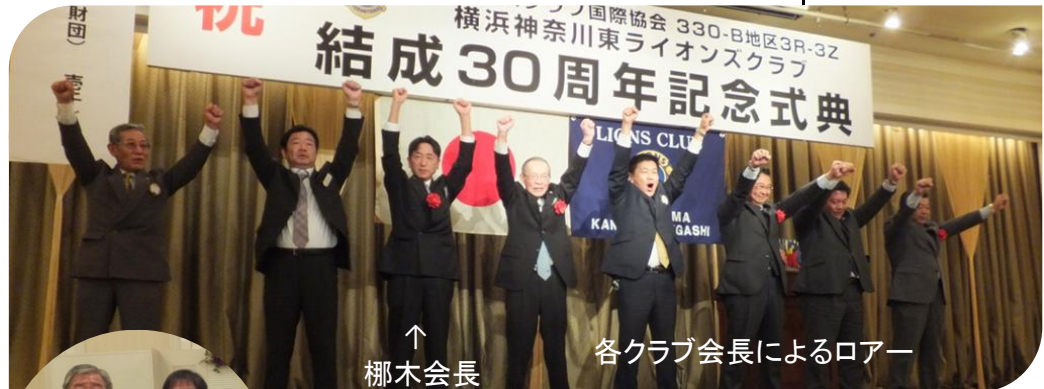
↑ 榎木会長 各クラブ会長によるローア