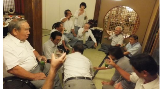
罰ゲーム 青汁で乾杯→