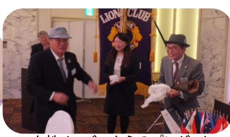
女性メンバーからのプレゼント お披露目