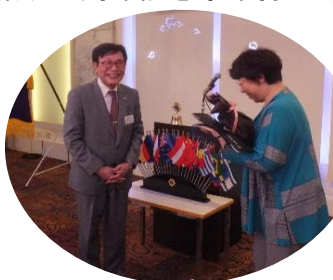
酒川25周年実行委員長へ