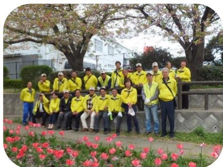
清掃の後、記念写真