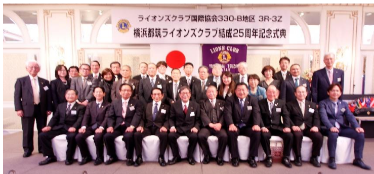
式典終了後、クラブメンバーによる記念写真