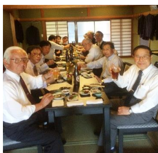
新富寿しで昼食例会