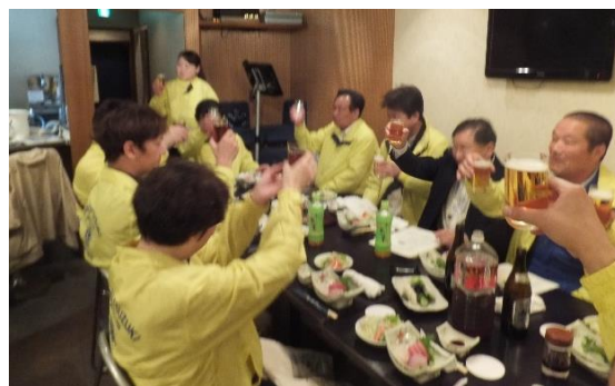
かつすい亭で昼食会