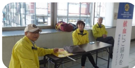
11月献血奉仕 センター南