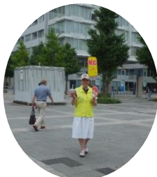
7月献血奉仕 センター北