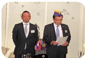
スポンサー河井Lと