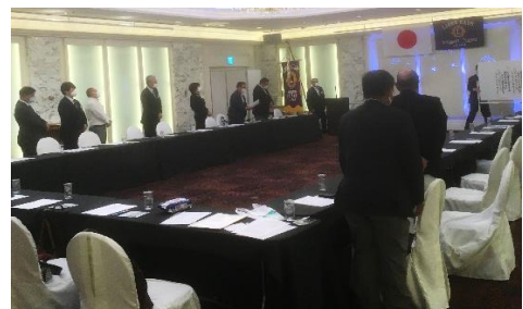
28期最後のローア 左から渡辺テーマ・畑澤テール・伊藤会計・ 相澤会長・城田幹事