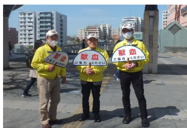
3月献血奉仕 センター北まつり中止 献血実行