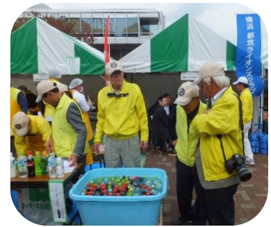
初登場 ペットボトル