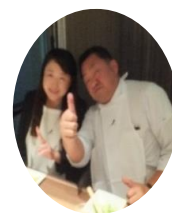
左・中:焼肉中 右:局長コンビ